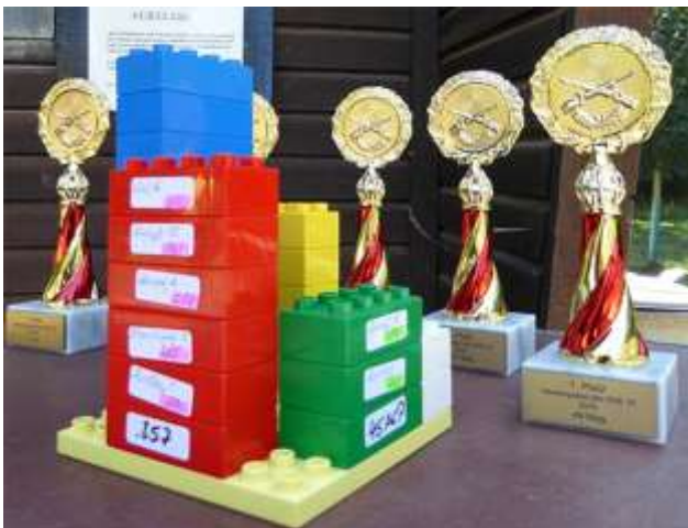
Das Liebsche Klötzeldisplay im Wettkampf

Gelang es im Herbst 2015 durch Ergebnismitteilung per "Post-It"-Zettel die Schützen zu überraschen, waren es dieses Jahr Bauklötzchen, die den Stand der Dinge erkennen ließen.