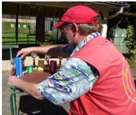
Wettkampfleiter beim Aktualisieren